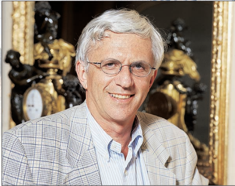
Bilder: Nicolas Y. Aebi

«Oper muss nicht intellektuell nachvollzogen werden können.»